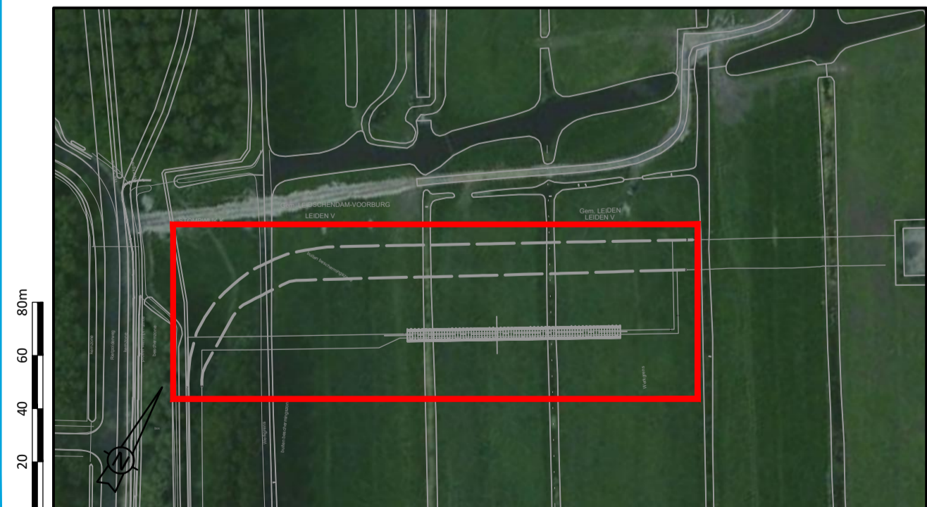
Situatie - schaal 1:2000